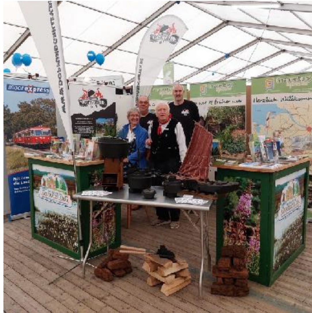
Teilnahme an Messen